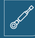
Gazlı Amortisörler Gas Springs