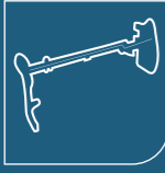
Torpido Travers Car Cross Beam