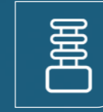
Titreşim Sönümleyicileri Vibration Dampers