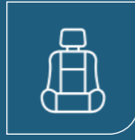
Koltuklar ve Koltuk Başlıkları Seats and Head Rests